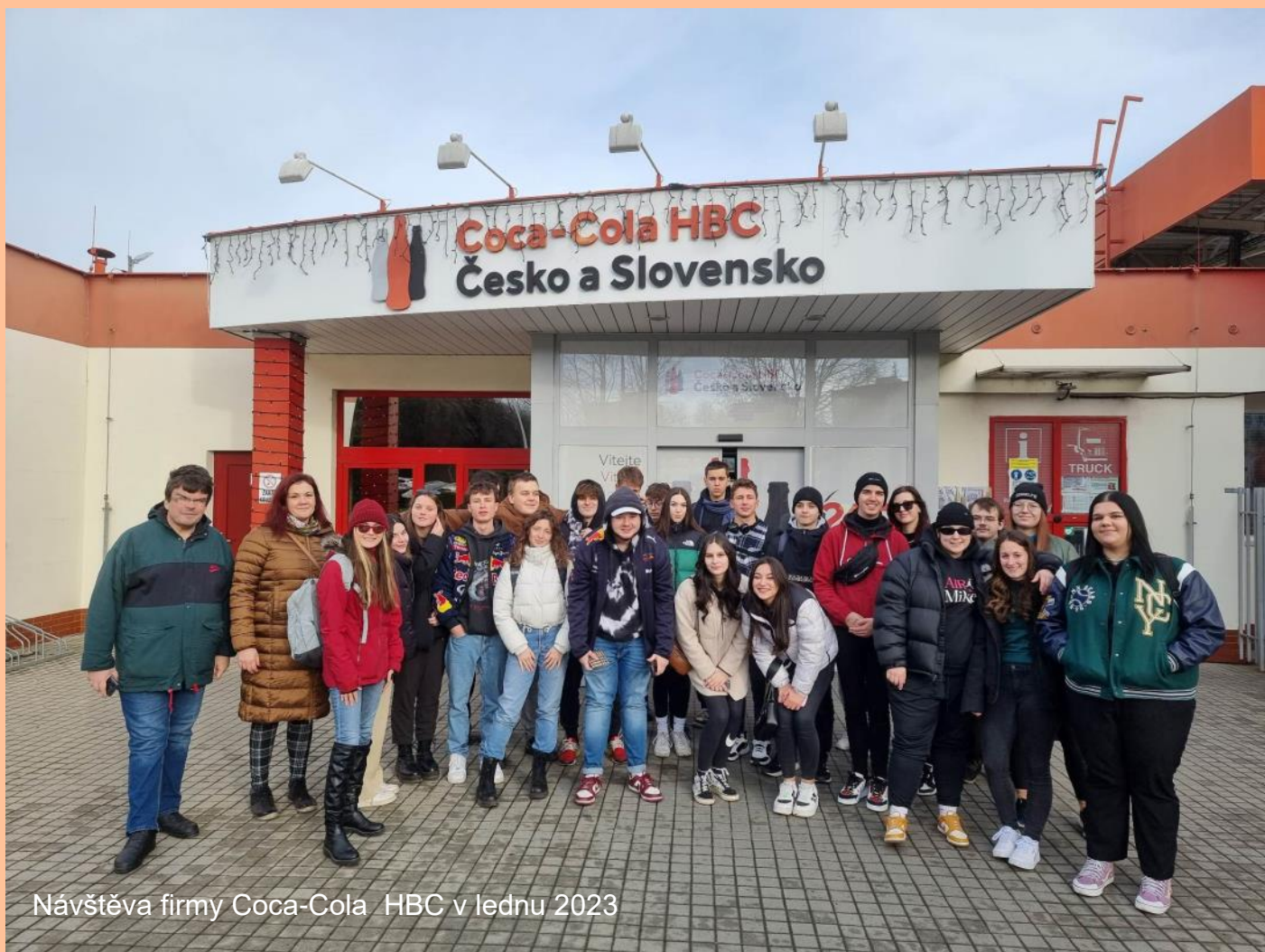
Návštěva firmy Coca-Cola HBC v lednu 2023