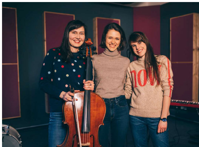
Skupina otázka času

Vděčná jsem za obě kapely. Myslím, že důležitost Vesny bude stoupat, protože myslím, že máme teď šanci, aby se kapela stala více známou a tím bychom měly i víc koncertů. Na podzim plánujeme turné po Česku, byly jsme pozvány do Polska a Bruselu. Přes léto se budeme věnovat nové desce, Skterá se stylisticky stáčí k písničkám z nového EP. Myslím si, že tahle hudba má potenciál zaznít i na větších podiích, než jsme hrály doteď, takže třeba zavítáme i na nějaké větší české festivaly... S Otázkou času se teď připravujeme na natáčení našeho prvního CDčka, takže po krůčcích postupujeme vpřed,