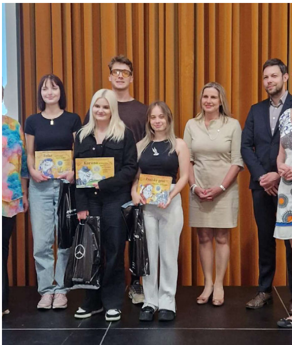
Vítězný tým při vyhlášení celostátního kola

senzační úspěch našich žáků v soutěži Rozpočti si to!